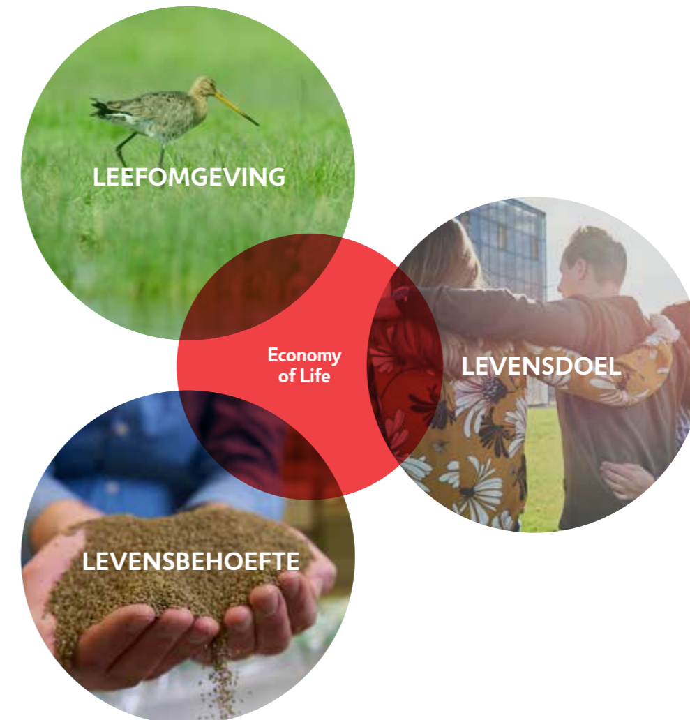
Figuur 2. Economy of Life.

Wij werken aan de Economy of Life. In de Economy of Life werken mensen vanuit rentmeesterschap aan de gezonde balans tussen geven en nemen. Studenten en medewerkers van de hogeschool streven ernaar om de drie pijlers van de Economy of Life – levensdoel, levensbehoefte en leefomgeving – met elkaar in evenwicht te laten zijn (zie: figuur 2 ). Ze worden uitgedaagd om persoonlijke en gedeelde waarden te ontwikkelen, die in de Economy of Life van betekenis zijn.