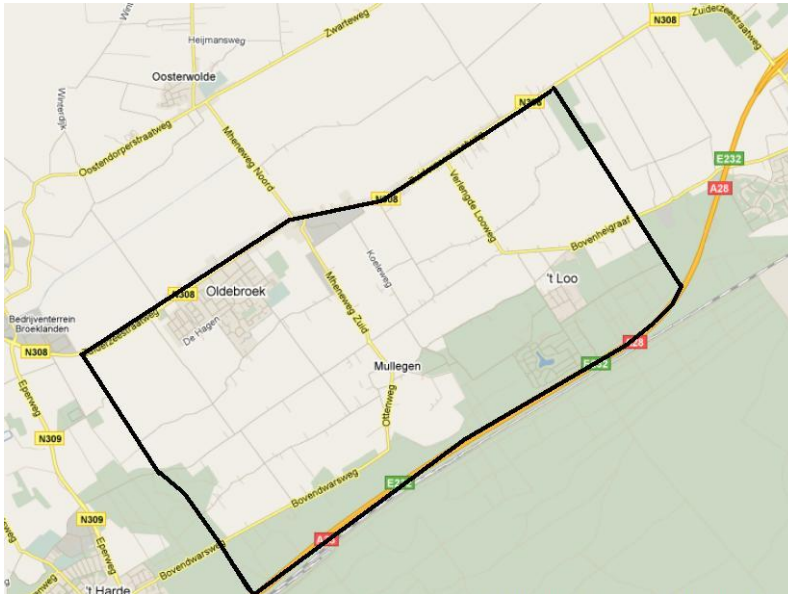
Figuur 1. Het gebied binnen de zwarte markering is het werkgebied.

Het werkgebied voor het energielandschap bestaat uit het landschappelijke overgangsgedebied tussen de A28 en de Zuiderzeestraatweg, en tussen de Broekeroordsweg (doorgetrokken tot de Zuiderzeestraatweg) en de Laanzichtsweg. In figuur 1 is het gebied met een zwarte lijn weergegeven. Het werkgebied ligt volledig binnen de gemeente Oldebroek. Mocht het nu gekozen gebied onvoldoende biomassa opleveren dan kan het alsnog worden uitgebreid met het gebied van één of enkele terreinbeheerders.